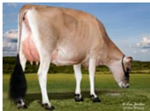
Jx Pvf Prop Joe Zap, moeder van Zander