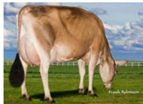
Jx Faria Brothers Magnum Milan, moeder van Hayward