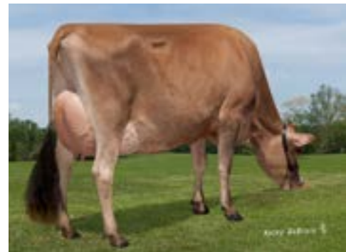
Pine-tree Lexicon Frosty, 86 pnt., moeder van Fastidious

*Zie toelichting op de kortingen hieronder