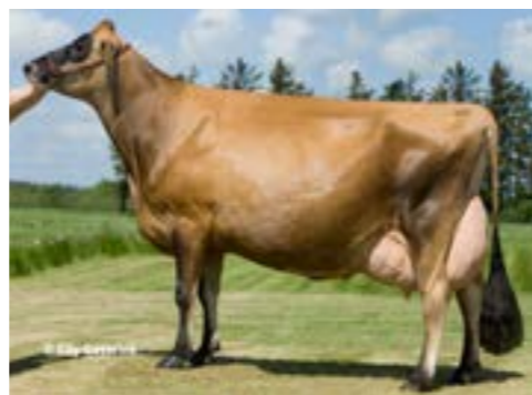
Bomann Lacca Lisa, moeder van Primal